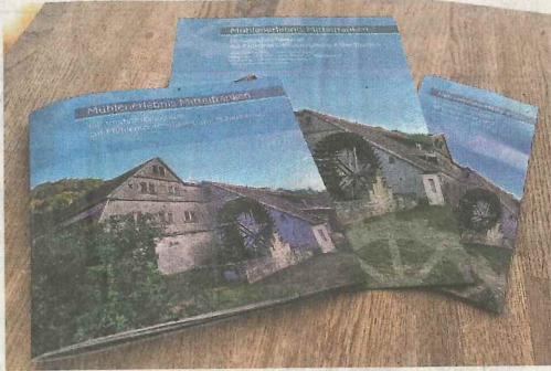
Das Begleitmaterial zur Wanderausstellung „Mühlenerlebnis Mittelfranken“ ist kostenlos erhältlich: Die 80-seitige Begleitbroschüre, das didaktische Konzept und der Werbeflyer

Auf insgesamt sechs Ausstellungstürmen können sich interessierte Besucher mithilfe zahlreicher, teilweise historischer Aufnahmen über die verbliebenen oder mittlerweile verschwundenen Mühlen in der Region informieren.