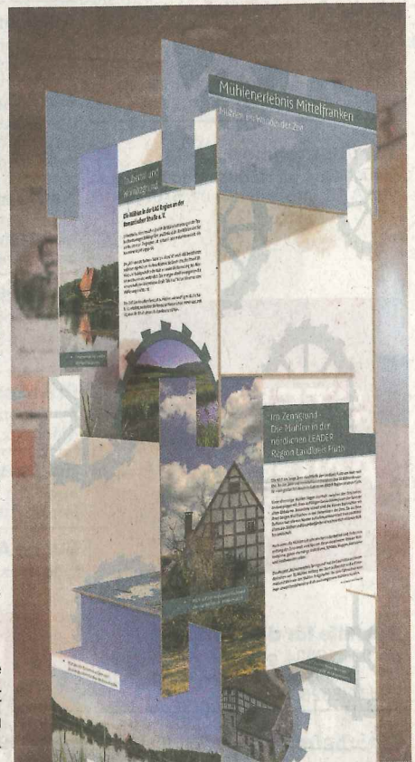
Einer der sechs Ausstellungstürme der Wanderausstellung „Mühlenerlebnis Mittelfranken“.